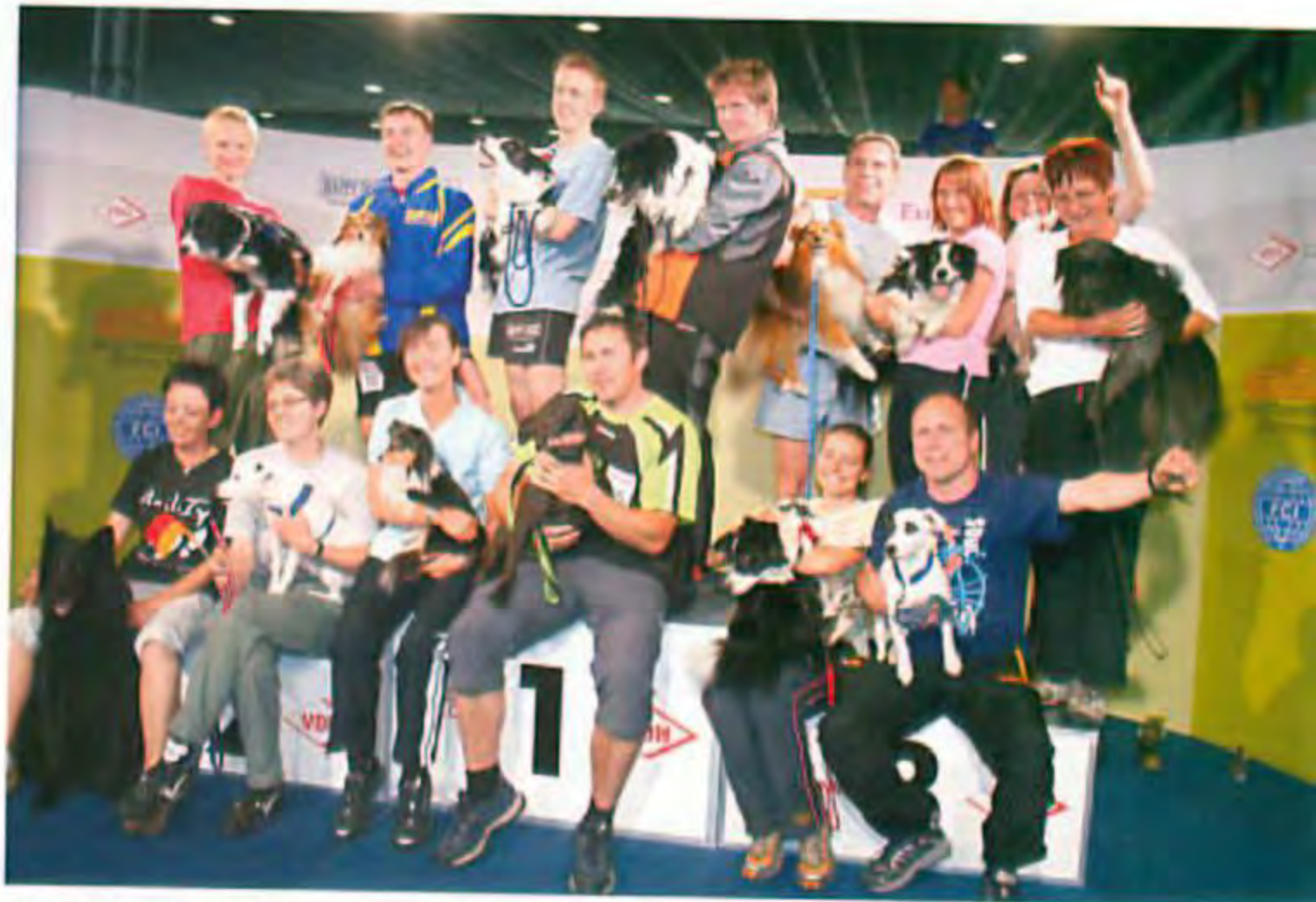
„Team Germany 2007“

Wir drücken allen Startern die Daumen und wünschen Ihnen, dass sie an die Erfolge der Mannschaft der letzten Jahre anknüpfen können und zudem ihre persönlichen Ziele verwirklichen können.